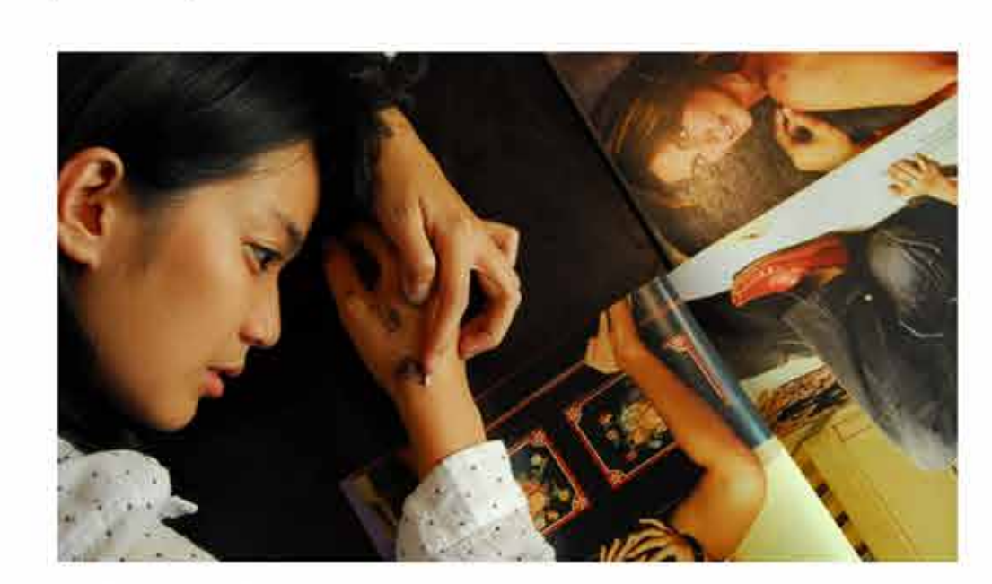
Friday, October 11 2019 / 19.00

Setelah mengalami peristiwa yang mengerikan, May menyepi dan berhenti bicara. Ayahnya, yang merasa bersalah atas peristiwa tersebut, menemani hidup May dan melampiaskan amarahnya lewat tinju. Suatu hari, sebuah lubang muncul dari kamar May dan menarik perhatiannya.