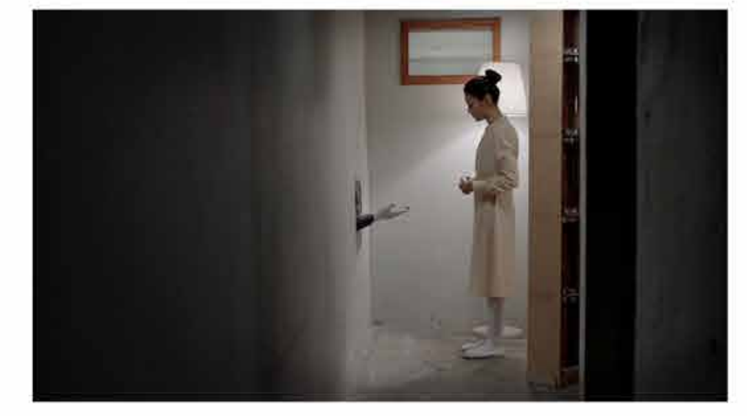
Friday, October 4 2019 / 21.30 Sunday, October 20 2019 / 19.00

Empat mahasiswa baru berseteru dengan seniornya. Karena di kampus dilarang berkelahi, perseteruan mereka diselesaikan dengan cara adu gebuk bantal. Dengan bantuan seorang pensiunan pendekar, mereka berlatih.