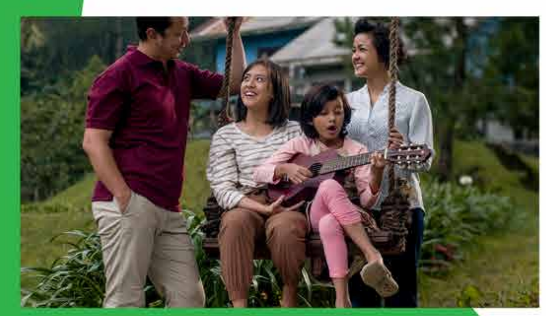
Saturday, October 5 2019 / 19.00

Kami menayangkan beberapa karya dari Visinema yang bertransformasi hari ini hingga menjadi salah satu rumah produksi yang memiliki rencana jangka panjang lewat sejumlah film yang akan diproduksi.