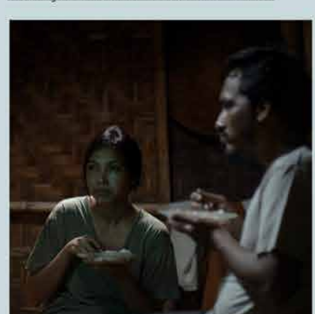
Ballad of Blood and Two White Buckets

Friday, October 11 2019 / 21.30 Sunday, October 20 2019 / 16.30 Friday, October 25 2019 / 19.00