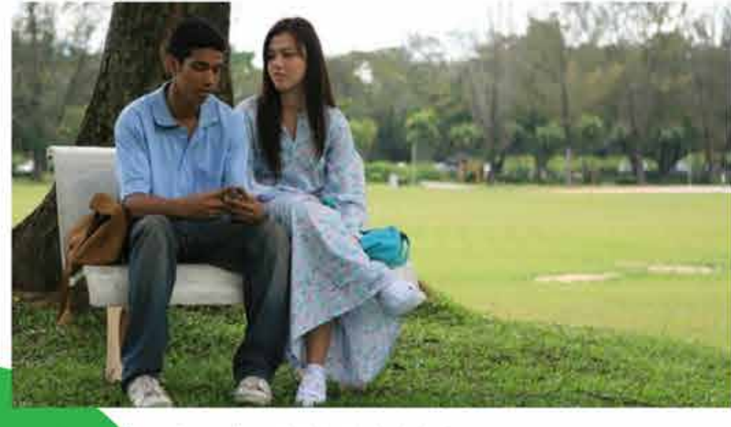
Wednesday, October 9 2019 / 19.00 Saturday, October 19 2019 / 19.00

Sepasang lansia pindah dari kota ke desa, tetapi pasangan yang penuh semangat dan penuh kasih sayang ini menemukan bahwa kehidupan di pedesaan tidak begitu menyenangkan.