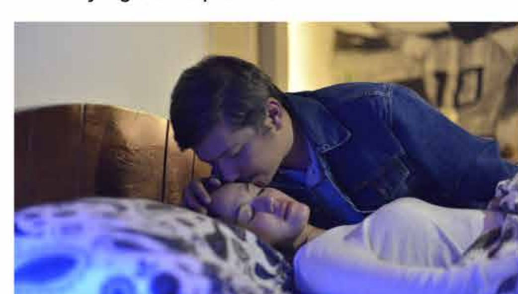
Saturday, October 5 2019 / 21.30

Sebuah keluarga yang berisi empat orang harus menghadapi kenyataan pahit bahwa mereka kehilangan harta benda setelah salah satu anggota keluarga besar mereka melakukan kesalahan. Berpindah dari satu tempat ke tempat baru, keluarga ini membutuhkan adaptasi dalam segala hal dan memaknai ulang makna keluarga mereka sendiri.